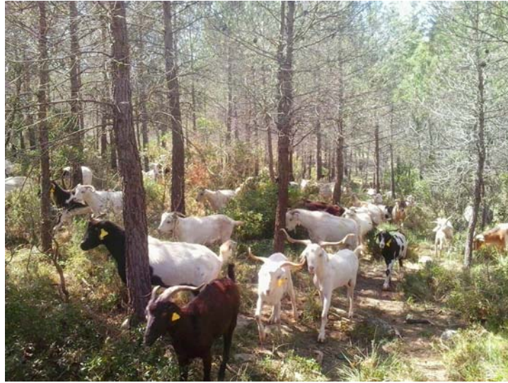
Pasturant amb 500 cabres desapareixen 3,5 tn. de vegetació diàriament que equival a 1.278 tn. anuals