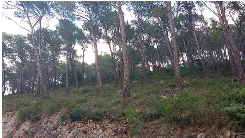
Franja de baixa combustibilitat al costat de la carretera del Coll d'Arca treballada pel ramat de cabres